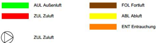
Auszug elektro Schema RWA Anlage