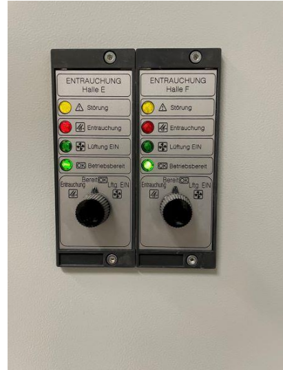
Feuerwehrtableau Air Kraft