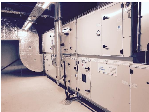
Monobloc mit ZUL / ABL 10'000 m 3 /h