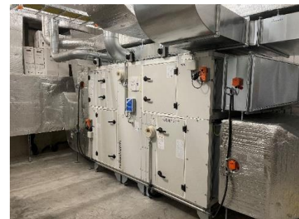
Lüftungsgerät mit 5'700 m3/h

Installateur: E3 HLK AG, Winterthur Planer: Consultair AG, Wädenswil