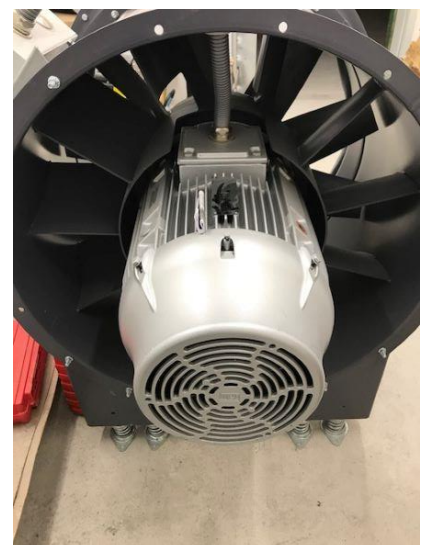
Ventilator, 21'000 m 3 /h