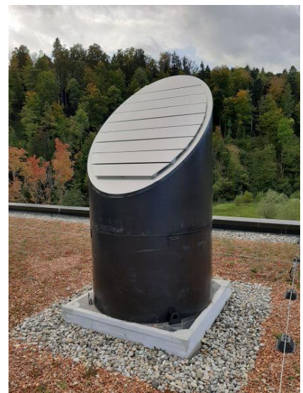
Ausblaus mit Klappe

Projektbeschreibung: Entrauchungsanlage mit 2x 30'000 m 3 /h und 2x JetFan je 4'500 m 3 /h inkl. Steuerung/Regelung von Air Kraft AG