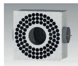
Draller mit Lüftungs-Box