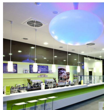
Auslass eingebettet in Decke