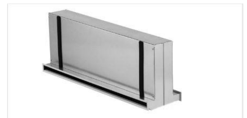
Gehäuse mit schmalen Schlitz

Installateur: Bouygues E&S InTec Schweiz AG, Luzern