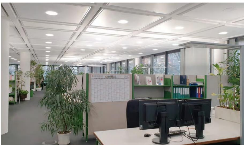
Bürräume des Businesscenters

Produkt: Kiefer INDUSILENT, Typ TG 230 Anzahl 350 Stück